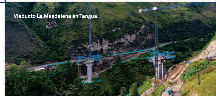
Viaducto La Magdalena en Tangua.

7 La Magdalena, en Tangua: 50 metros de alto y 193 metros de longitud. Estado: Elevación de sus pilas principales y el armado los carros de avance.