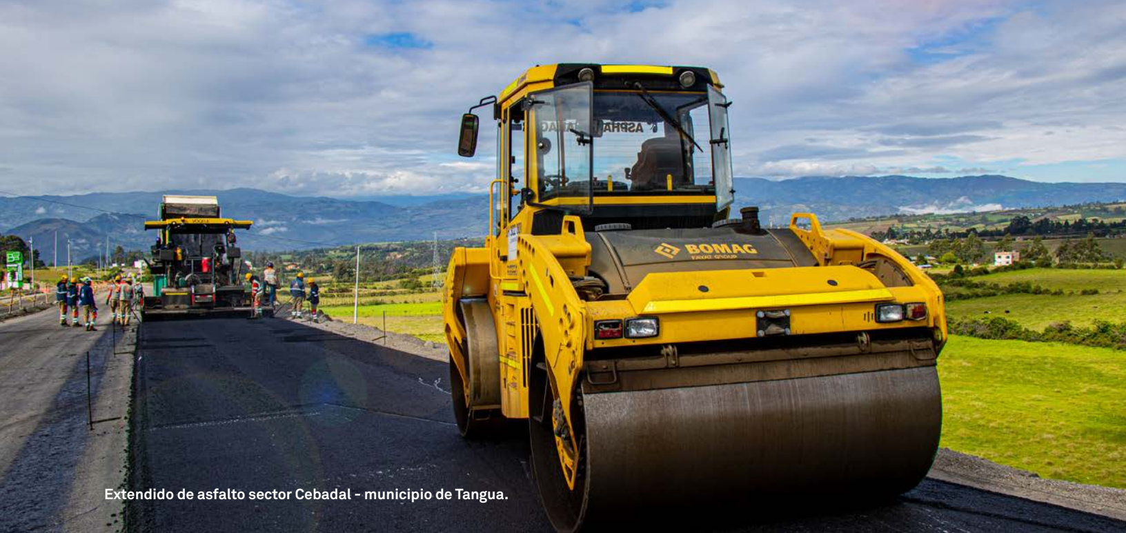
Extendido de asfalto sector Cebadal - municipio de Tangua.