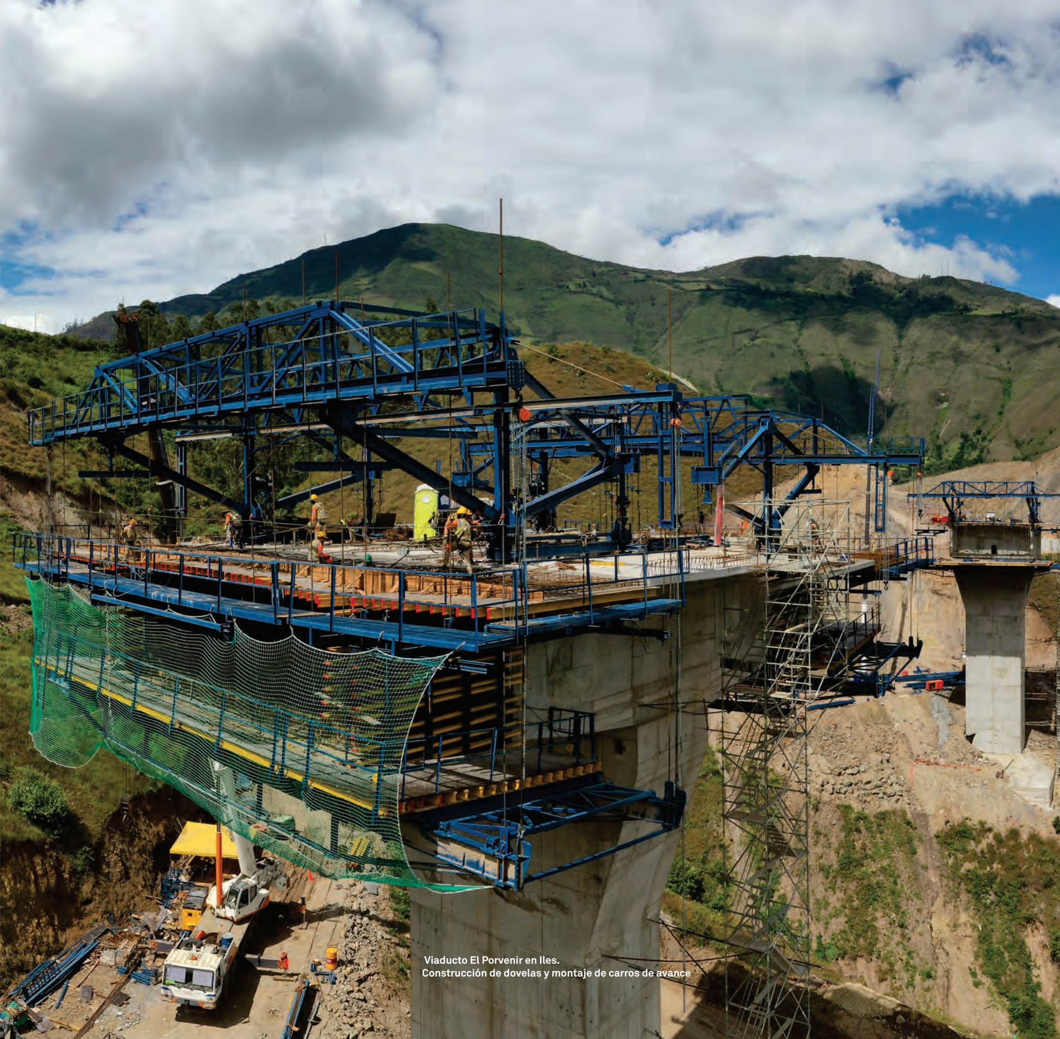
Viaducto El Porvenir en Iles. Construcción de dovelas y montaje de carros de avance