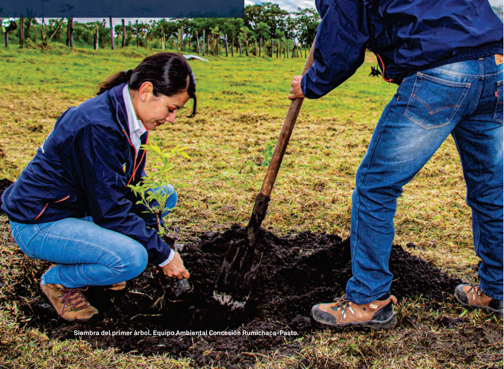
Siembra del primer árbol. Equipo Ambiental Concesión Rumichaca-Pasto.