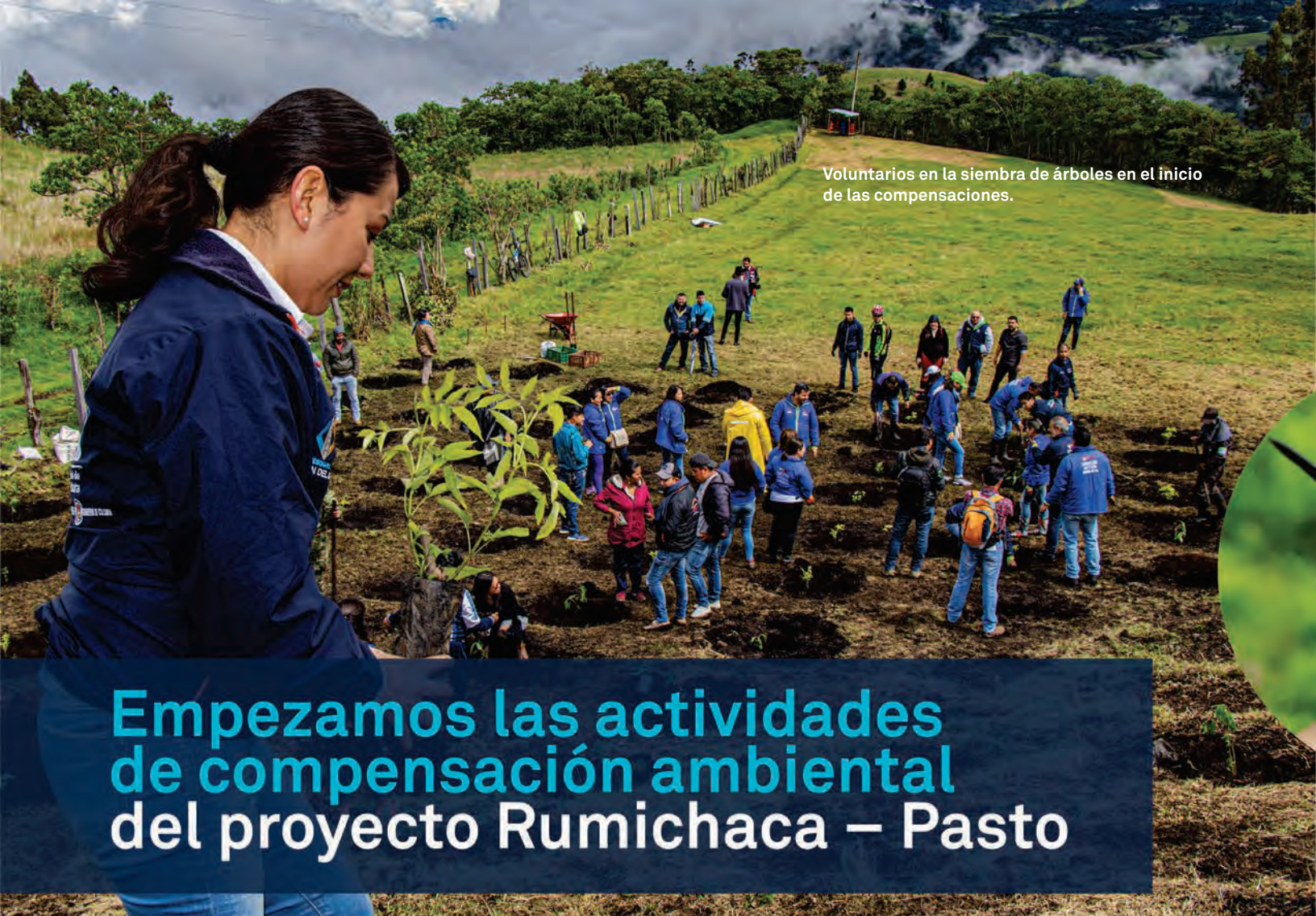
Voluntarios en la siembra de árboles en el inicio de las compensaciones.