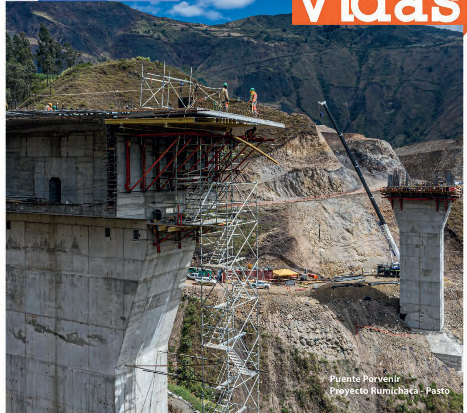
Puente Porvenir Proyecto Rumichaca - Pasto

Construimos infraestructura que conecta vidas