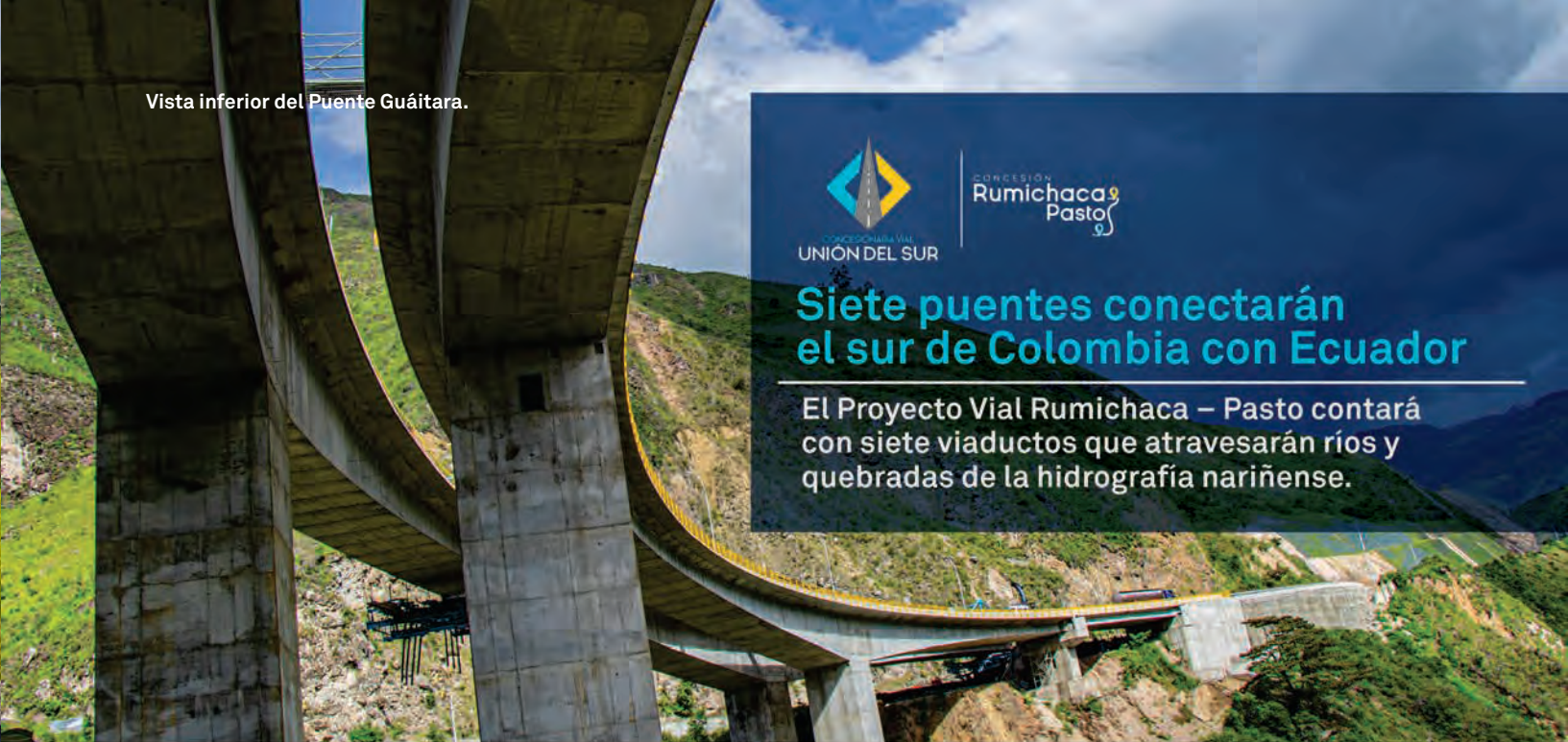
Vista inferior del Puente Guaitara.