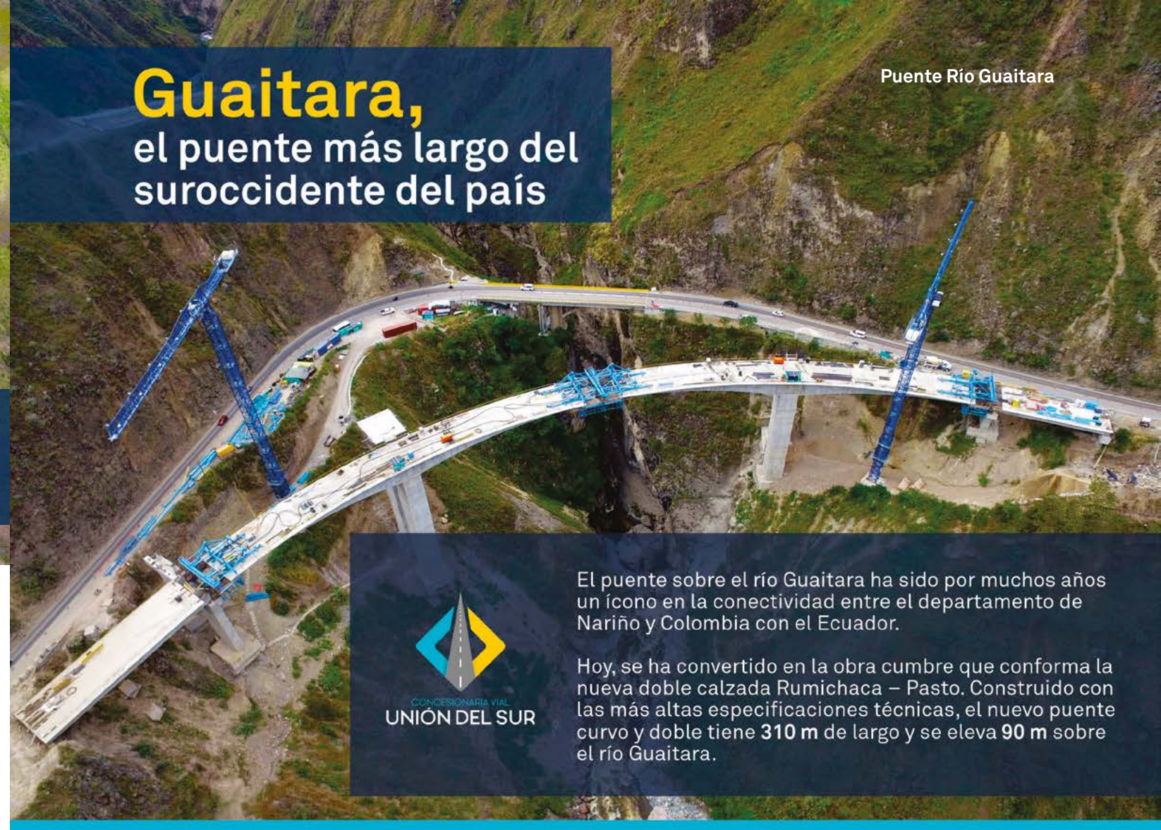
Puente Río Guaitara

En este tramo se construyen 33 Km de doble calzada y 5 Km de mejoramiento