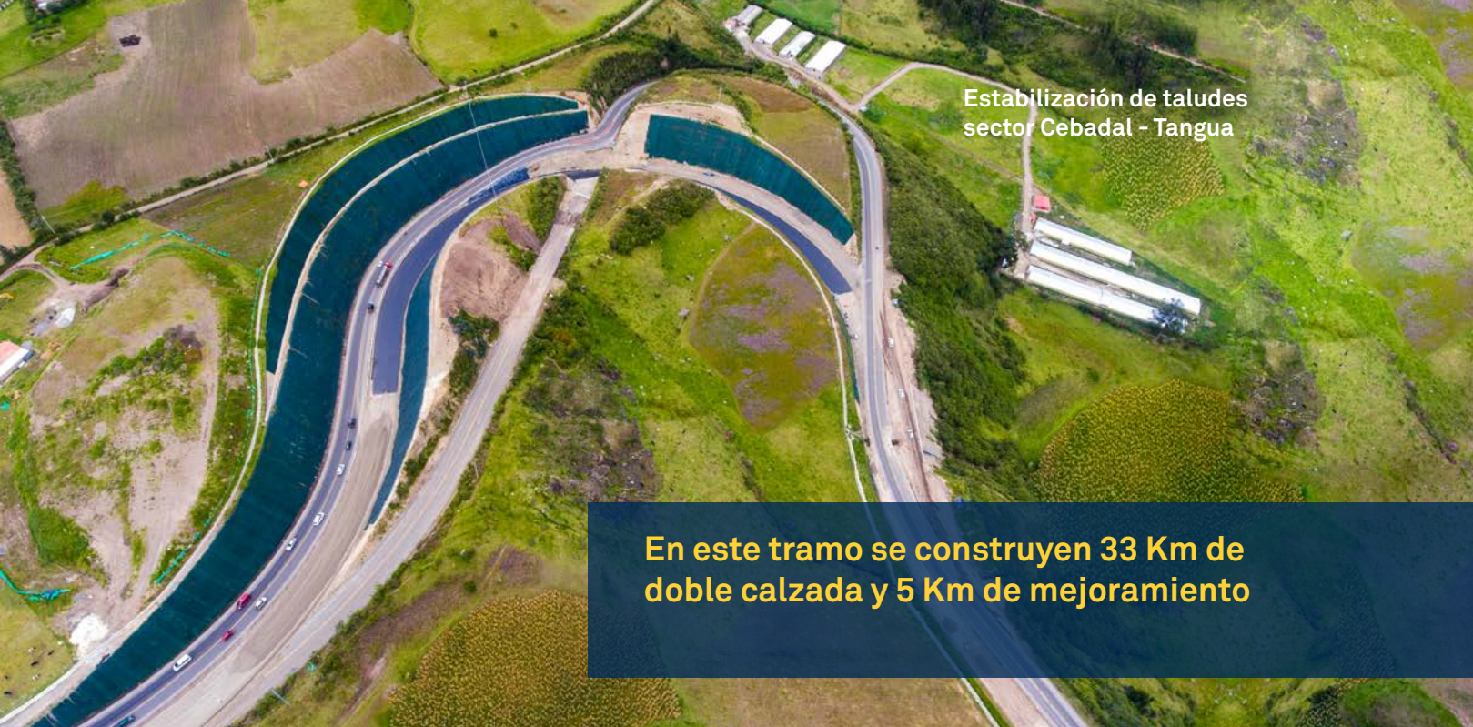
Estabilización de taludes sector Cebadal - Tangua

En este tramo se construyen 33 Km de doble calzada y 5 Km de mejoramiento