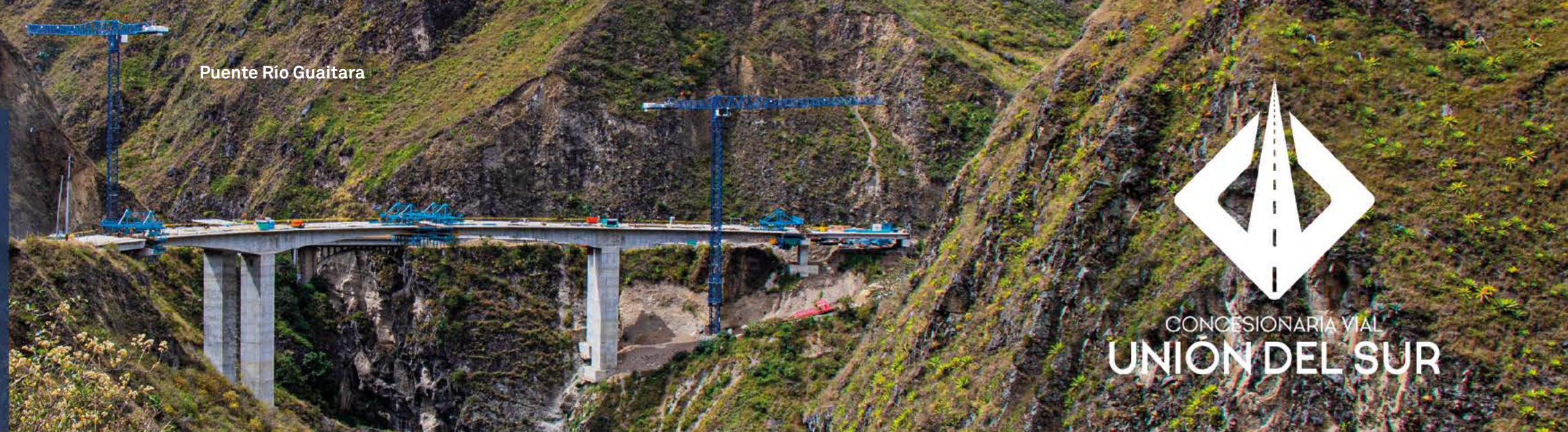
Puente Río Guaitara