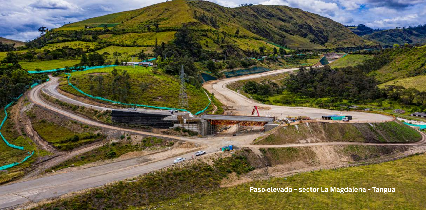
Paso elevado - sector La Magdalena - Tangua